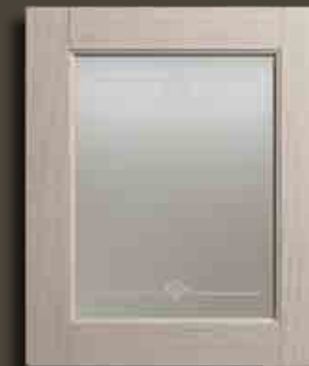
JUTA E VETRO SATINATO