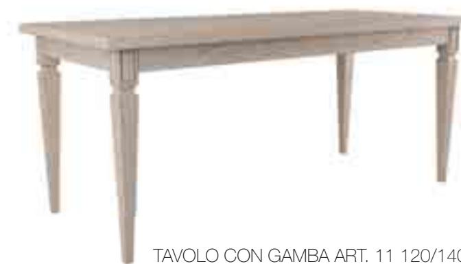
TAVOLO CON GAMBA ART. 11 120/140/160 X 80