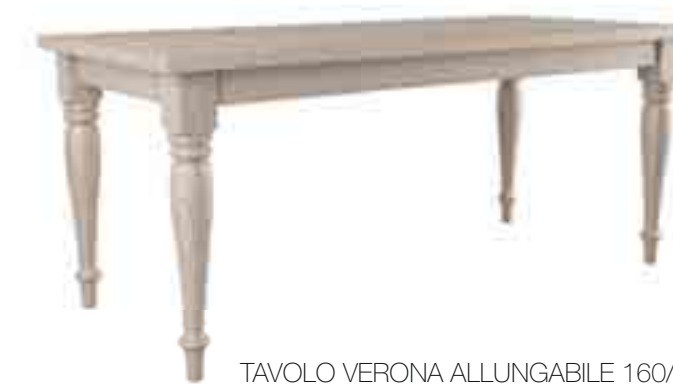
TAVOLO VERONA ALLUNGABILE 160/180/200/250 X 90