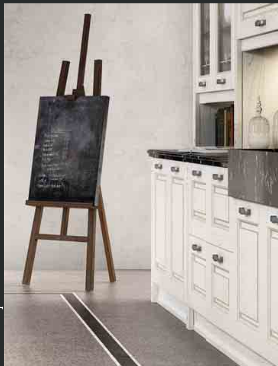
Wood Decapé Bianco

A choice of strong character upheld by the importance of this arrangement combining a large two-sided island and wall-fitted tall display unit.