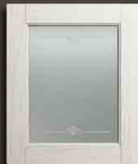
DECAPE' BIANCO E VETRO SATINATO