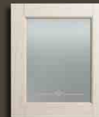
DECAPE' AVORIO E VETRO SATINATO