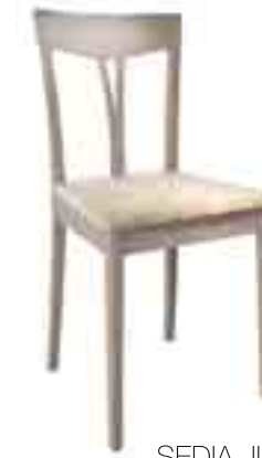
SEDIA JUTA ART. 480 COD. 6120