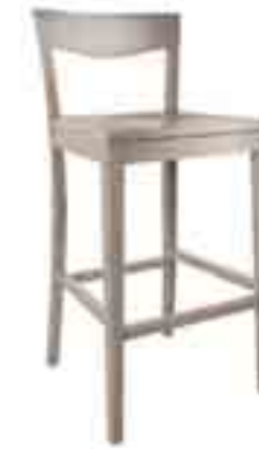
SGABELLO JUTA ART. 482 COD. 6140L