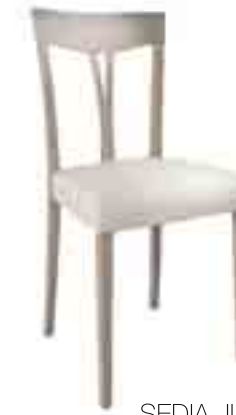
SEDIA JUTA ART. 480 COD. 6120T