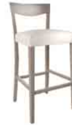
SGABELLO JUTA ART. 482 COD. 6140T