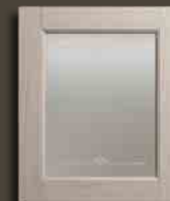
JUTA E VETRO SATINATO