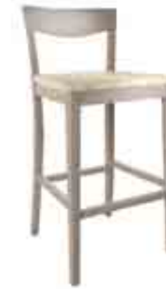
SGABELLO JUTA ART. 482 COD. 6140