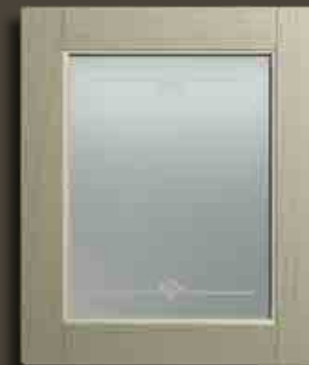
VERDE SALVIA E VETRO SATINATO