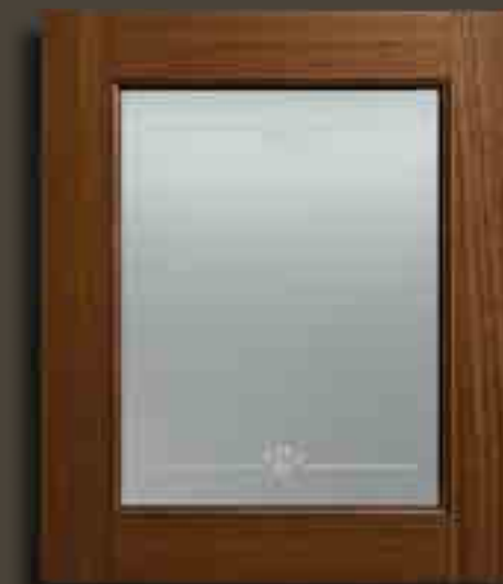
NOCE CARAVAGGIO E VETRO SATINATO