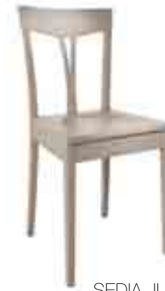
SEDIA JUTA ART. 480 COD. 6120L