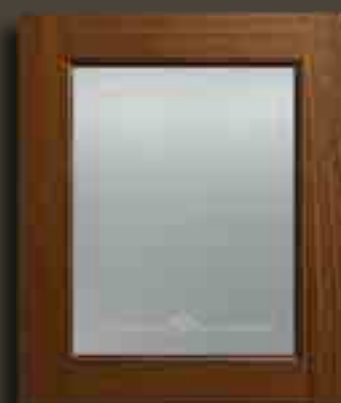
NOCE CARAVAGGIO E VETRO SATINATO