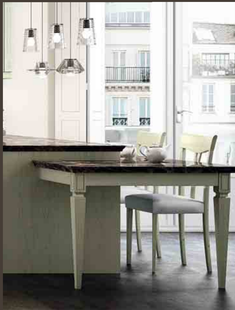
Wood Verde Salvia

The open unit situated at the end of the arrangement makes maximum use of the space available and suggests new ideas for its interpretation.