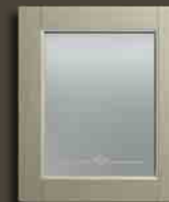
VERDE SALVIA E VETRO SATINATO