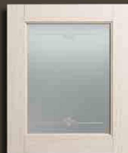
DECAPE' AVORIO E VETRO SATINATO