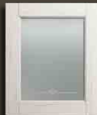
DECAPE' BIANCO E VETRO SATINATO