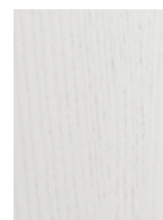
PORO APERTO BIANCO