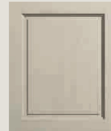
LACCATO PORO APERTO CORDA