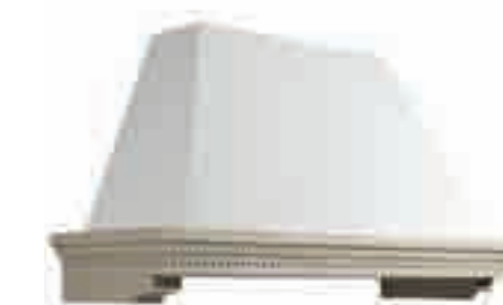
CAPPA VIRGINIA BIANCA