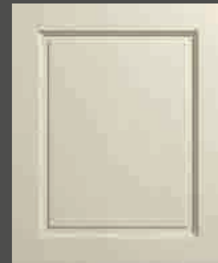
LACCATO PORO APERTO FRASSINO AVORIO