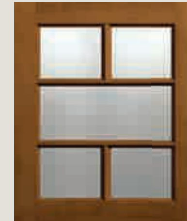
IMPIALLACCIATO CILIEGIO VETRO TRASPARENTE