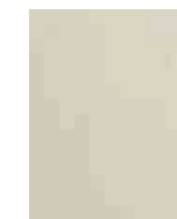
PORO APERTO FRASSINO AVORIO