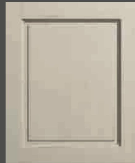
LACCATO PORO APERTO CORDA