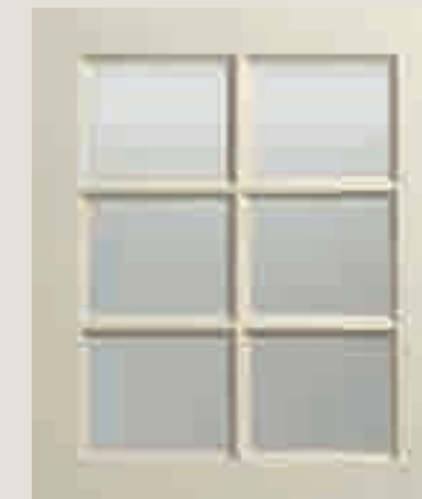
LACCATO PORO APERTO FRASSINO AVORIO VETRO TRASPARENTE