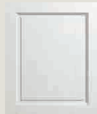
LACCATO PORO APERTO BIANCO