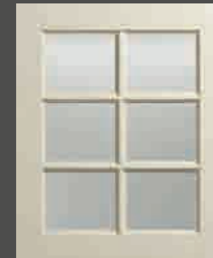
LACCATO PORO APERTO FRASSINO AVORIO