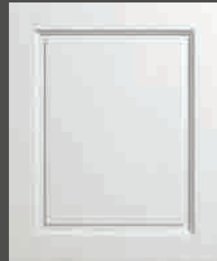
LACCATO PORO APERTO BIANCO