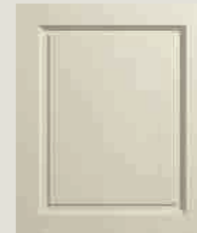
LACCATO PORO APERTO FRASSINO AVORIO