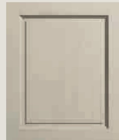
LACCATO PORO APERTO CORDA