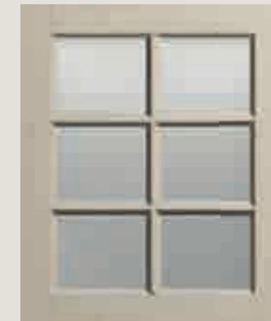
LACCATO PORO APERTO CORDA VETRO TRASPARENTE