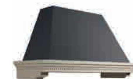
CAPPA VIRGINIA GRIGIA