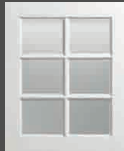
LACCATO PORO APERTO BIANCO