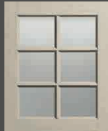
LACCATO PORO APERTO CORDA