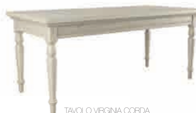
TAVOLO VIRGINIA CORDA